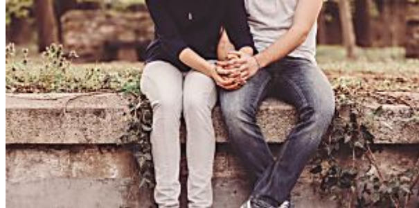
Dia dos Namorados: 12 sugestões para curtir a data com economia