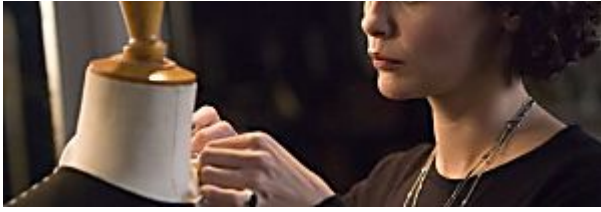
5 filmes para inspirar você a montar seu próprio negócio