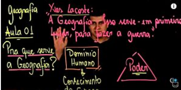
Mais de 800 aulas gratuitas preparam os estudantes para o ENEM