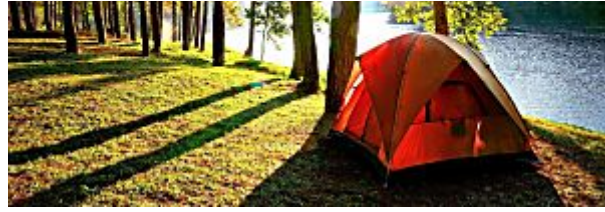
5 dicas para quem vai acampar pela primeira vez