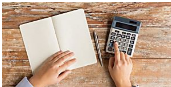
Especialista em finanças dá dica de ouro para organizar os gastos